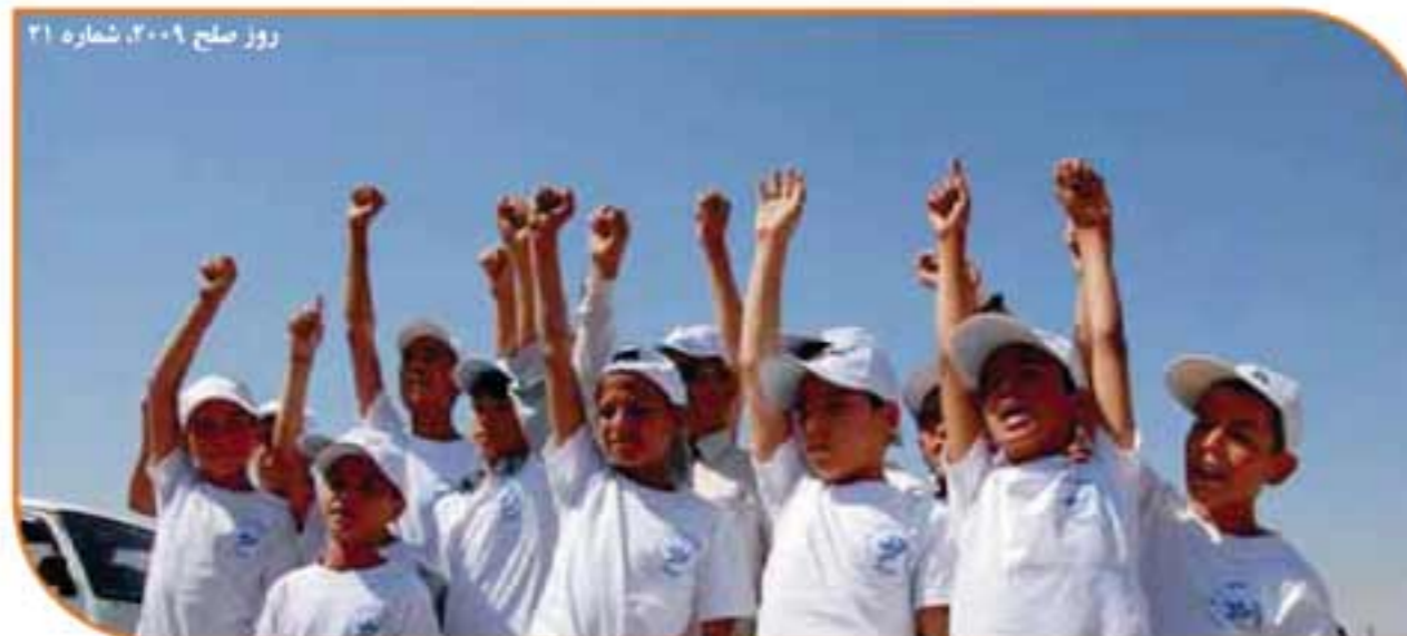
روز صلح ۲۰۰۹، شماره ۲۱

قطعنامه در پایان از "تمام کشورهای عضو، سازمانهای سیستم ملل متحد، سازمانهای منظوقی و غیردولتی و افراد دعوت بعمل میاورد تا از روز جهانی صلح به طریقه مناسب، منجمله از طریق تعلیم و آگاهی دهی عامه یادبود بعمل آورده و با ملل متحد در راستای ایجاد یک آتش بس جهانی همکاری نمایند."