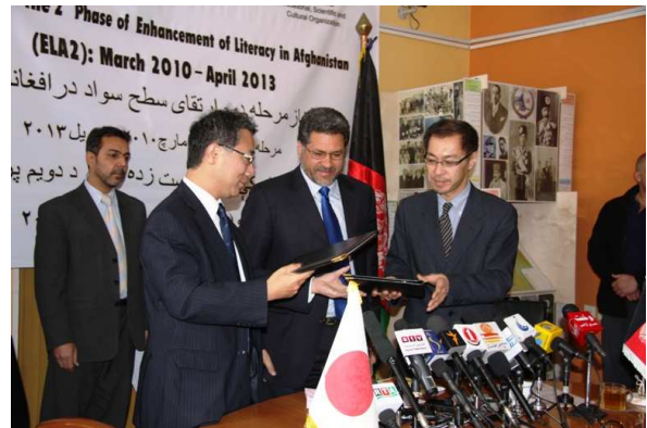
آقای شیگویی هیرواکی سفیر جاپان (چپ)، و آقای شیگیرو آیوگی رئیس یونسکو در افغانستان (راست) در حال تبادل اسناد تفاهم در حضور آقای فاروق وردک، وزیر معارف (وسط)

سواد حق اساسی بشر بوده که میتواند به وضعیت اجتماعی، اقتصادی و سیاسی جامعه سودمند باشد. مهیا ساختن زمینه سواد آموزی برای افراد بی بضاعت، نقش بسیار مهم را در آوردن صلح در کشور ایفا نموده و مرحله اول و دوم برنامه ارتقا سواد آموزی در افغانستان، کمک مهم در این پروسه از طریق بالا بردن مهارت های حیاتی افراد، و انکشاف در کشور مینماید.