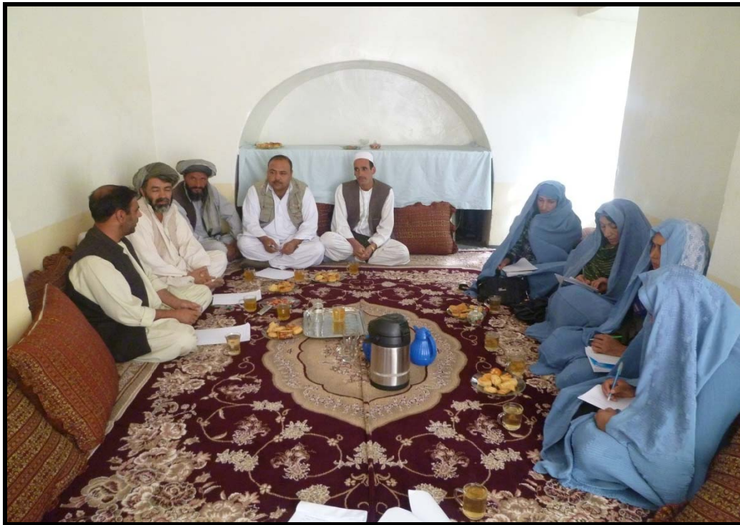
گفتمان مردم- بحث گروهی در غرب افغانستان، 2011