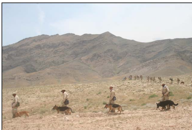
د چهار آسياب په ولسوالۍ كې د MDD د دماين پاكولو ټيمونه - جون ۲۰۰۹

د افغانستان دماين پاكي چارو دهمغري مركز ( MACCA ) چې دملگرو ملتونو له خوايې ملاتړ كيږي دپيښو سره دمبارزي درياست ( ANDMA ) په چوكاټ كې دماين پاكولو درياست ( DMC ) له لپاري دگډ كار لپاره لاره هواره كړه تر څو په افغانستان كې دماين اړوند چارو دپلان جوړولو ، هم غړۍ او دكيفيت دښه كولو چارې تر سره كړي . دوزارتونو تر منځ وروستۍ غونډه دمارچ دمياشتې په ترڅ كې تر سره شوه چې پكې دمس عينك دموضوع تر څنگ پر نورو مهمو موضوعاتو بحث وشو او دوزارتونو تر منځ معلومات شريك شول.