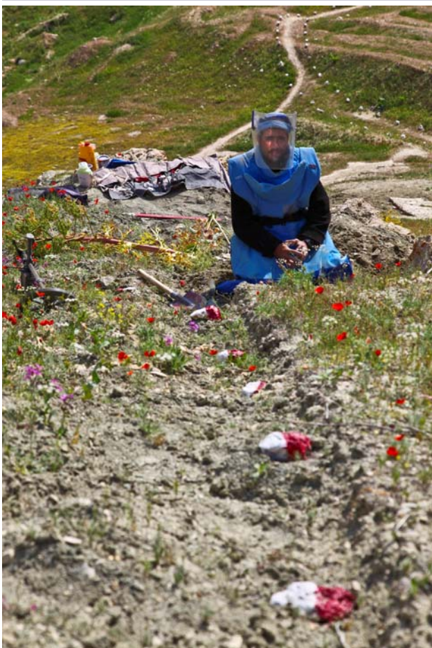
دسمنگانو په ولايت كې دماين پاكي عمليات

دماين پاكي بشري پروگرام په كال ۱۳۶۸ كې په افغانستان كې رامنځ ته شو چې دماين پاكي ټول اركان پكې نغښتي دي لكه تبليغات ، سروې ، دماينونو پاكول ، دماينونو دزيړمو له منځه وړل ، دماينونو دخطر په اړه زده كړې او دماينونو له قربانيانو سره مرسته. د افغانستان دماين پاكي پروگرام دملگرو ملتونو د وجهې صندوق او نورو دوه اړخيزو او څو اړخيزو لارو تمويليږي.