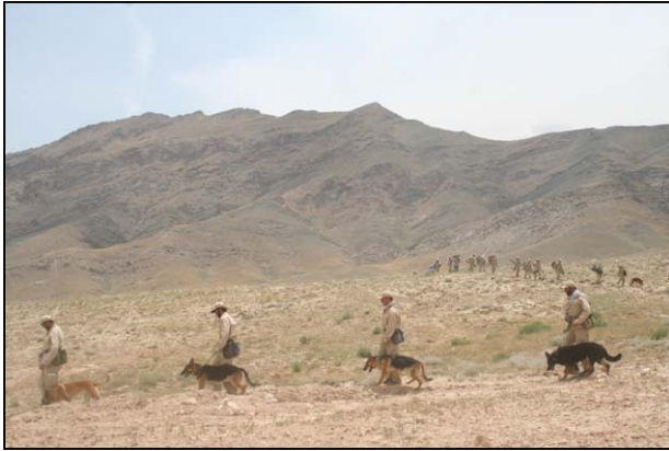
دچهار آسياب په ولسوالۍ كې د MDD دماين پاكولو ټيمونه - جون ۲۰۰۹

دافغانستان دماين پاكي چارو دهمغري مركز ( MACCA ) چې دملگرو ملتونو له خوايې ملاتړ كيږي دپيښو سره دمبارزې درياست ( ANDMA ) په چوكاټ كې دماين پاكولو درياست ( DMC ) له ليارې دگډ كار لپاره لاره هواره كړه تر څو په افغانستان كې دماين اړوند چارو دپلان جوړولو ، هم غړۍ او دكيفيت دښه كولو چارې تر سره كړي . دوزارتونو تر منځ وروستۍ غونډه دمارچ دمياشتې په ترڅ كې تر سره شوه چې پكې دمس عيڼك دمووضوع تر څنگ پر نورو مهمو موضوعاتو بحث وشو او دوزارتونو تر منځ معلومات شريك شول.