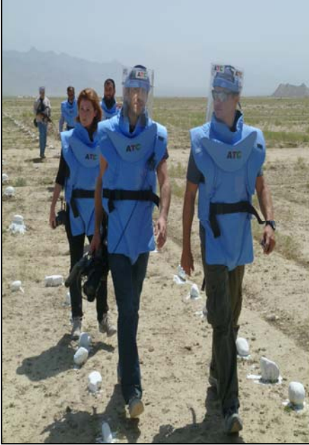
جیریمی رینر د بگرام په ولسوالۍ کې د ماین د ساحې څخه لیدنه کوي

روانه میاشت د افغانستان د ماین پاکي چارو دهمغري مرکز د امریکایي فلمونو د نامتو ستوري کوربه و چې دهرې لاکر په نوم فلم یې د اوسکار جایزه خپله کړې وه. نوموړی دملګرو ملتونو دپلاوي په ډله کې په نړیواله توګه د ماینونو په اړه دپوهاوي دکچې دلورولو په موخه افغانستان ته سفر درلود تر څو په دې هیواد کې د ماین پاکي پرسونل کار له نږدې څخه وګوري.