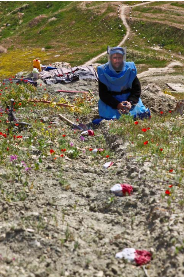
دسنگانو په ولايت كې دماين پاكي عمليات

دماين پاكي بشري پروگرام په كال ۱۳۶۸ كې په افغانستان كې رامنځ ته شو چې دماين پاكي ټول اركان پكې نغښتي دي لكه تبليغات ، سروې ، دماينونو پاكول ، دماينونو دزيرمو له منځه وړل ، دماينونو دخطر په اړه زده كړې او دماينونو له قربانيانو سره مرسته. دافغانستان دماين پاكي پروگرام دملگرو ملتونو د وجهې صندوق او نورو دوه اړخيزو او څو اړخيزو لارو تمويليږي.