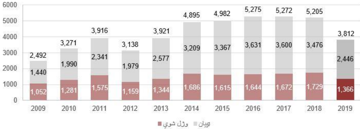
په جگړه کې د ښکېلو ډلو له خوا ملکي تلفات جنوري څخه تر جون ۲۰۱۹