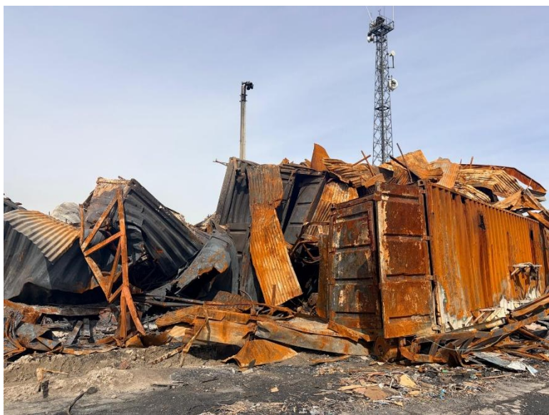
د اميد د روږدو د درملنې مرکز، د ويجار شوي ځای انځور، ۲۴ مارچ ۲۰۲۶

په افغانستان کې د پاکستان سفارت يوناما ته ويلي چې: «د مارچ د ۱۶ مې شپې عمليات يوازې د ترهگرو او پوځي زيربناوو پر ضد ترسره شول. هدفونه د ډرون زيرمتونونه، د تخنيکي ملاتړ مرکزونه او د وسلو زيرمتونونه وو، چې د افغان طالبانو د رژيم له خوا د پي گناه پاکستاني ملکي وگړو پر ضد د بريدونو لپاره کارول کېدل. دا بريدونه کره، هدفمند او مسلکي وو. هېڅ روغتون، د روږدو د درملنې مرکز، يا ملکي تاسيسات نه دي په نښه شوي». ۱۳