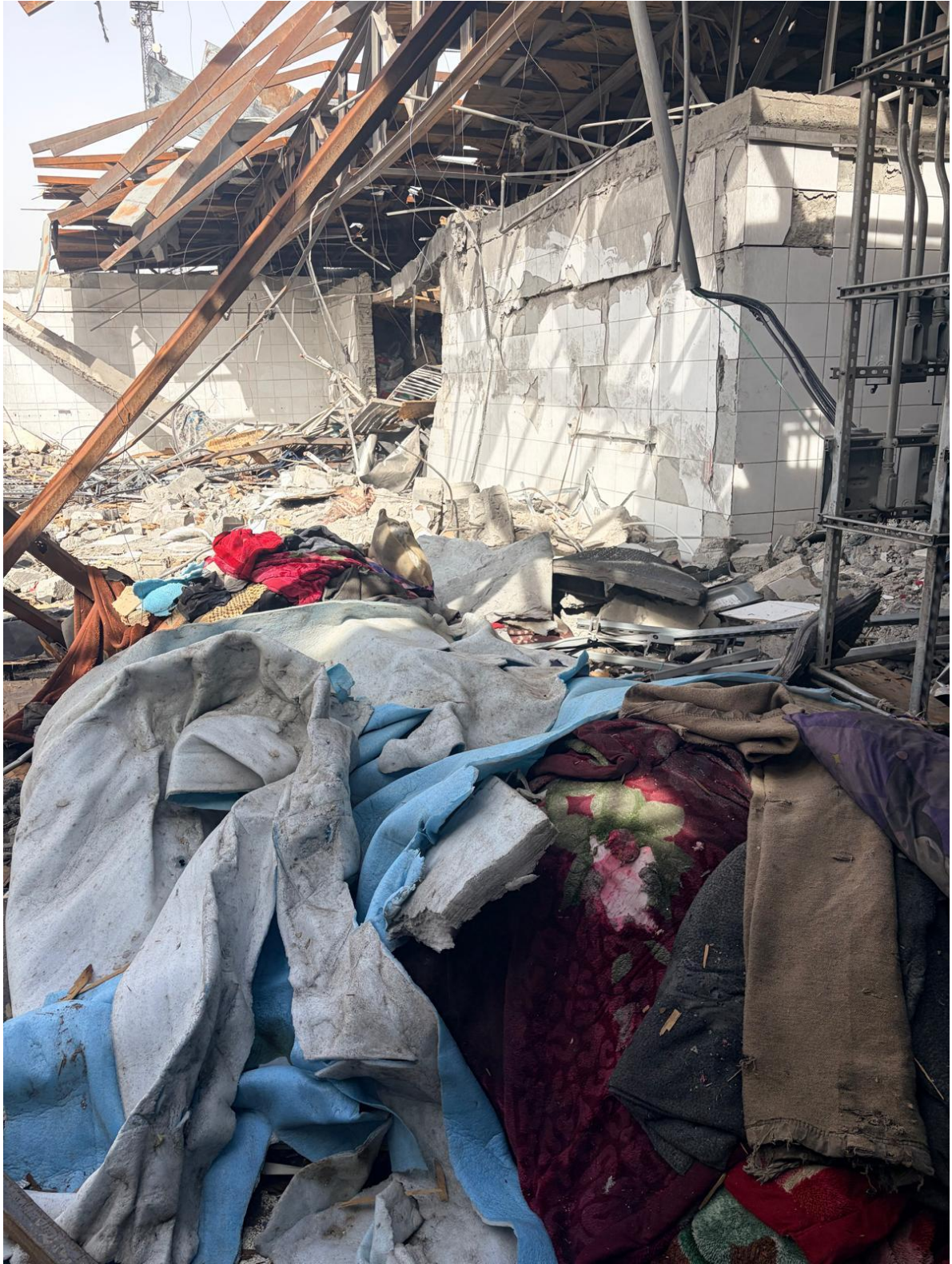
د امید د روړدو د درملني مرکز، د خوبخونو وړاني شوې ساحې، ۲۴ مارچ ۲۰۲۶