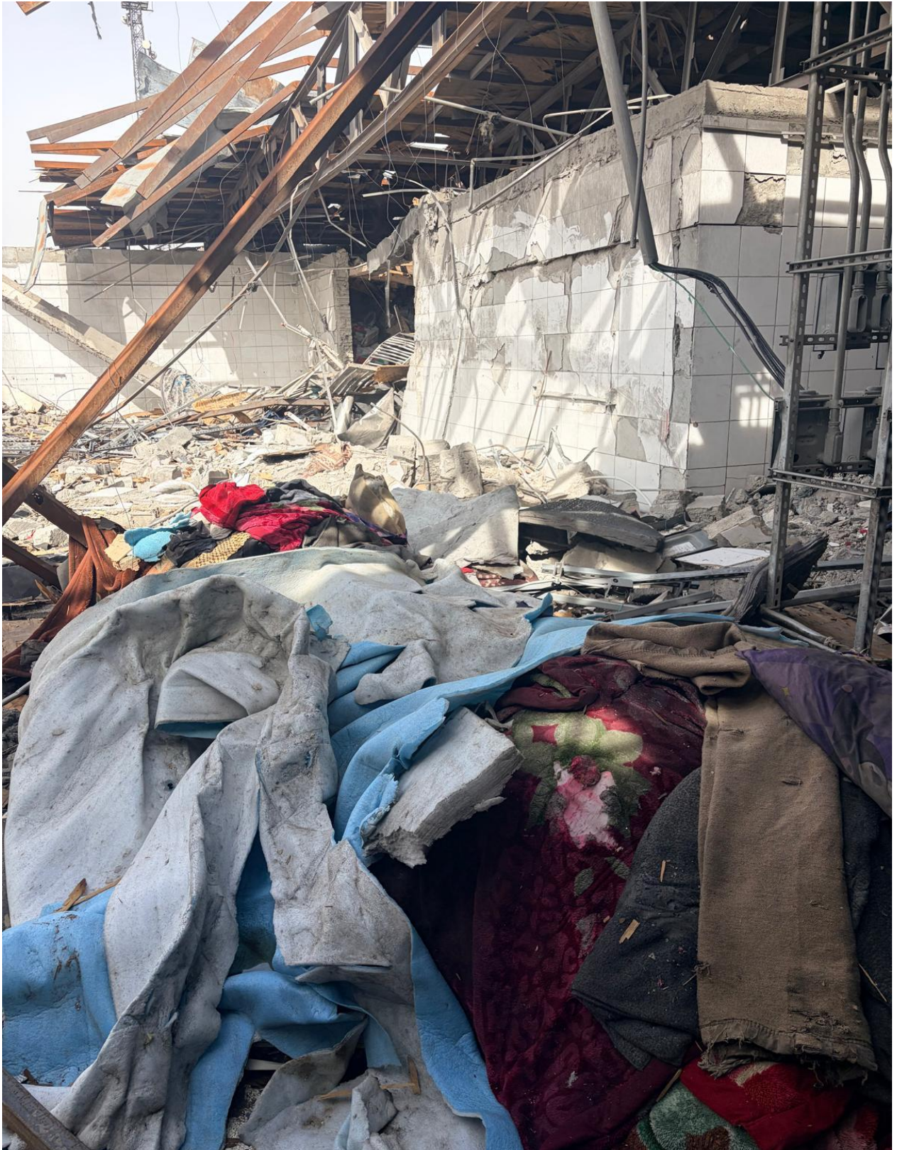
تصویری از خوابگاه های تخریب شده در شفاخانه تداوی معتادین امید ۲۴ مارچ ۲۰۲۶