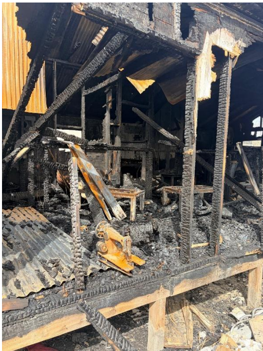
تصاویر از خرابه های ساحه آموزش های مسلکی در شفاخانه تداوی معتادین امید، ۲۴ مارچ ۲۰۲۶

سفارت پاکستان در افغانستان به صورت کتبی به یوناما اطلاع داد: «اقدامات پاکستان در شب ۱۶ مارچ صرفاً علیه زیر ساخت های تروریستی و نظامی انجام شده است. اهداف شامل ذخایر طیاره های بدون سرنشین و زیر ساخت های حمایتی فنی و همچنان مراکز ذخیره مهمات بوده است که توسط رژیم طالبان افغانستان برای انجام حملات علیه غیر نظامیان پاکستانی استفاده می شد. این حملات دقیق، هدفمند و حرفه ای بوده است. هیچ شفاخانه، مرکز تداوی اعتیاد یا تأسیسات غیرنظامی هدف قرار نگرفته است» ۱۳